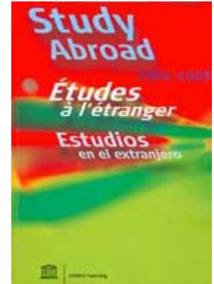
Study Abroad 2004-2005 ISBN 92-3-003888-1 678 pages

http://www.ozco.gov.au/issues/booksalive/pdfs/acnielsen_report.pdf